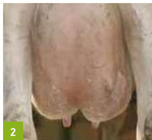
widok wymienia od tyłu