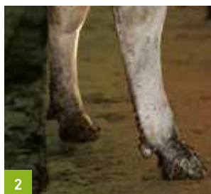
widok dolnej części nóg i racic