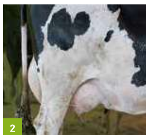
widok górnej części nóg